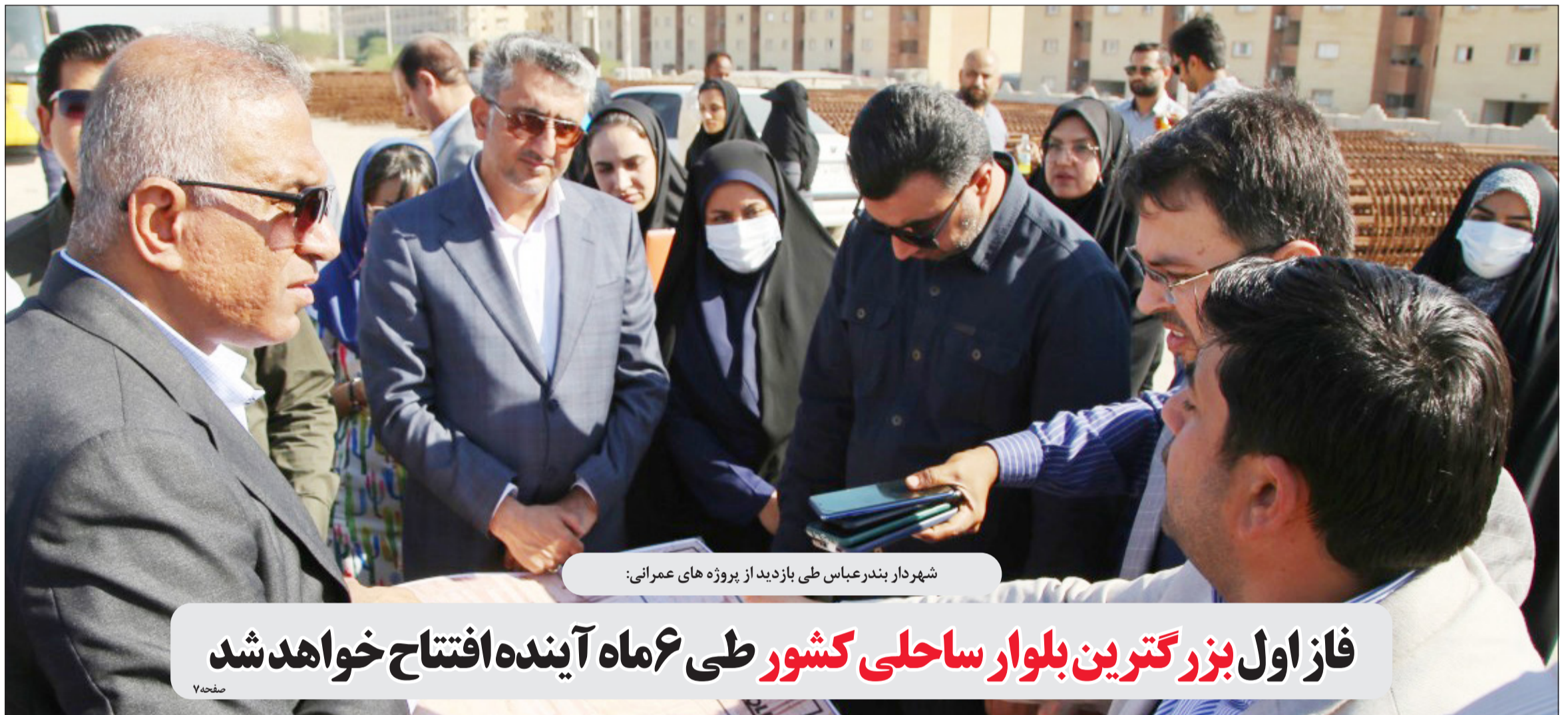
شهردار بندرعباس طی بازدید از پروژه های عمرانی:

سال بیستم شماره ۱۶۲۸ صفحه ۸ قیمت ۳۰۰۰ تومان