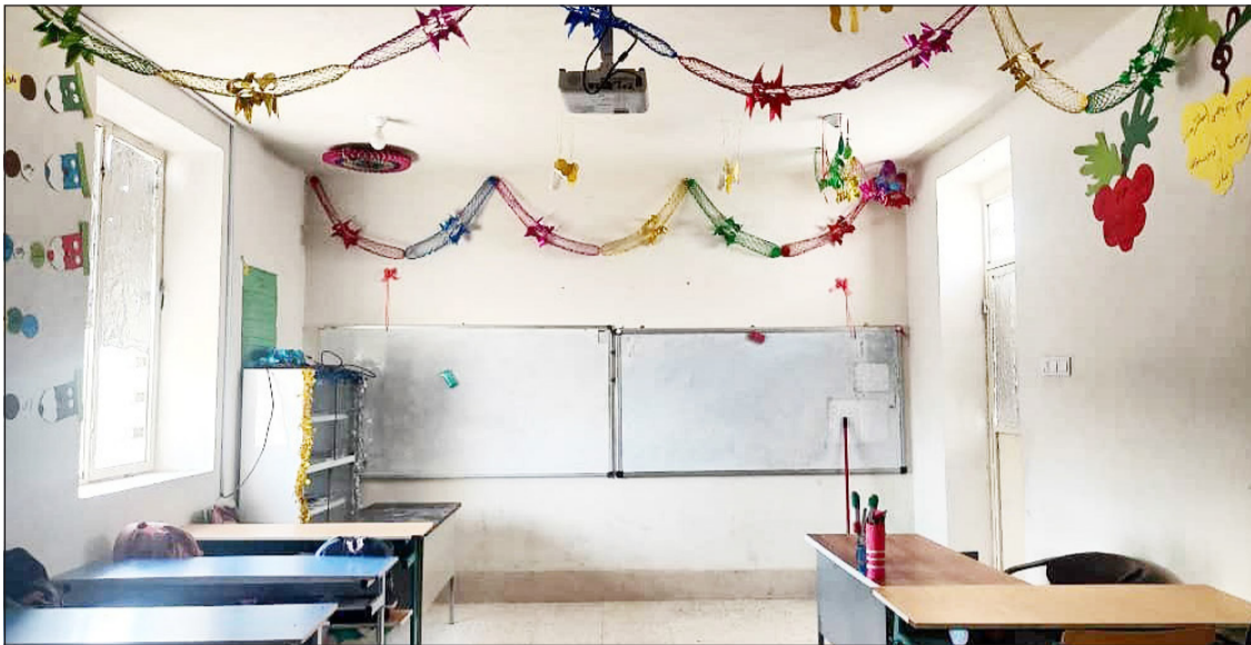
آنچه در پیش رو می خوانید کوچکترین ادای احترامی است که می توان به انسانی چنین وارسته انجام داد؛

انجام کار خیر، ارزشی اخلاقی و معنوی است که به حکم فطرت انسان، بسیار والا و ارزشمند بوده و تقریباً در همه ادیان الهی و آسمانی به این کار سفارش شده است.