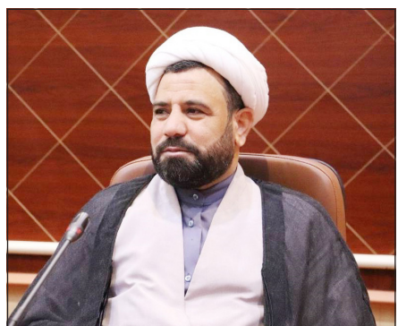
رئیس شورای اسلامی شهر بندرعباس گفت: افتتاح سالن معراج، راه‌اندازی دستگاه البسه‌سوز، آسفالت جاده خاکی و برنامه‌ریزی

برای خرید دو دستگاه ماشین برقی و سه دستگاه آمبولانس جدید، آرامستان بندرعباس را به سمت ارائه خدمات بهتر و در شأن شهروندان سوق می‌دهد. به گزارش دریای اندیشه، حجت‌الاسلام والمسلمین عبدالرضا حیدری سراجی، رئیس شورای شهر بندرعباس، در حاشیه بهره‌برداری از پروژه‌های جدید شهرداری بندرعباس گفت: امروز شاهد افتتاح سه پروژه مهم در آرامستان بندرعباس هستیم که اجرای آن‌ها منجر به بهبود خدمات‌رسانی و رفع دغدغه‌های شهروندان شده است. وی با اشاره به اهمیت این پروژه‌ها افزود: سه پروژه‌ای که امروز به بهره‌برداری رسید شامل سالن معراج، دستگاه البسه‌سوز و آسفالت جاده خاکی آرامستان است که از مطالبات جدی مردم به‌شمار می‌رفت. حجت‌الاسلام والمسلمین حیدری سراجی تصریح کرد: با توجه به گرمای شدید هوا و نبود فضای مناسب برای همراهان متوفیان،