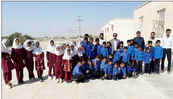
فضاهای آموزشی، زمینه‌ساز تحول در آموزش روستایی و پرورش نسلی توانمند و آگاه خواهد بود.

برخورداری همه دانش‌آموزان از امکانات برابر آموزشی، از اهداف مهم دولت در حوزه عدالت آموزشی است. با اجرای طرح‌های بهسازی مدارس و تجهیز فضاهای آموزشی، تلاش می‌شود انگیزه تحصیل در میان دانش‌آموزان مناطق کمتر برخوردار افزایش یابد. همچنین با مشارکت خیرین مدرسه‌ساز و همکاری مردم روستا در توسعه