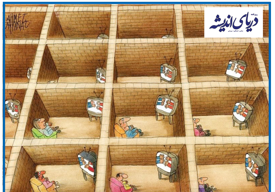
دریای اندیشه مجله فرهنگی و اجتماعی